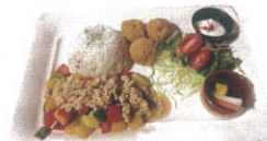
※季節限定ランチのイメージ